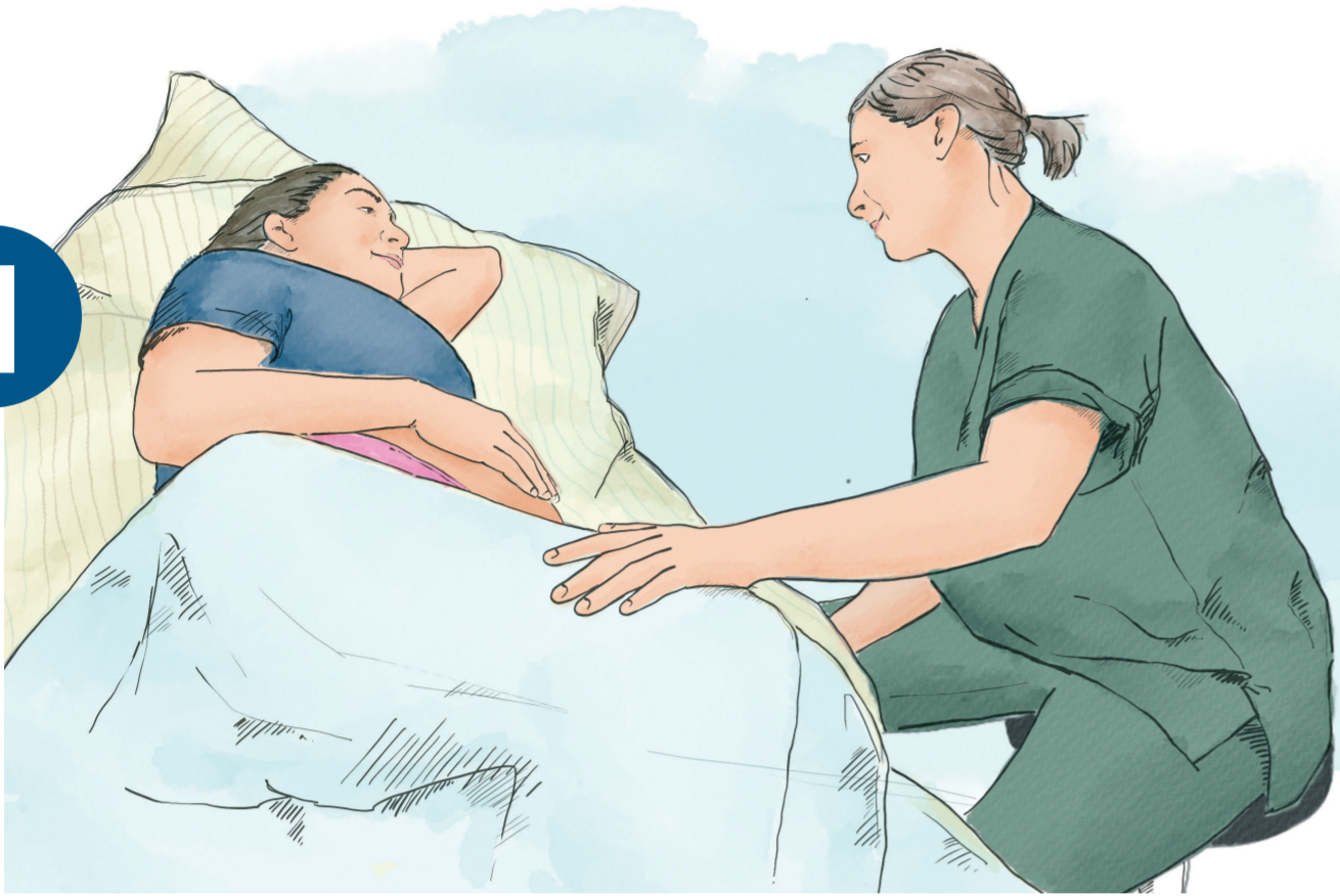
Information und Einwilligung