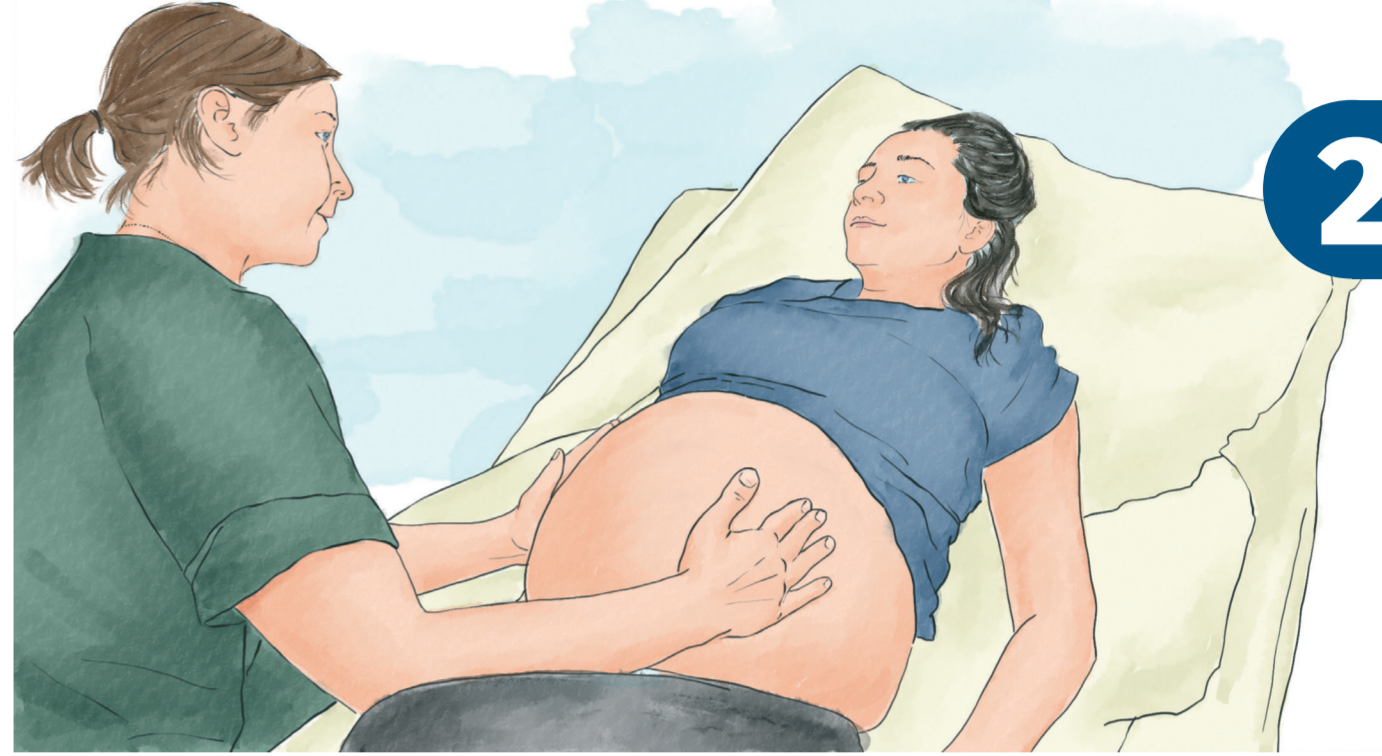
Bestimmung der kindlichen Lage